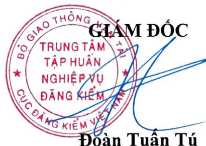
Đoàn Tuấn Tú